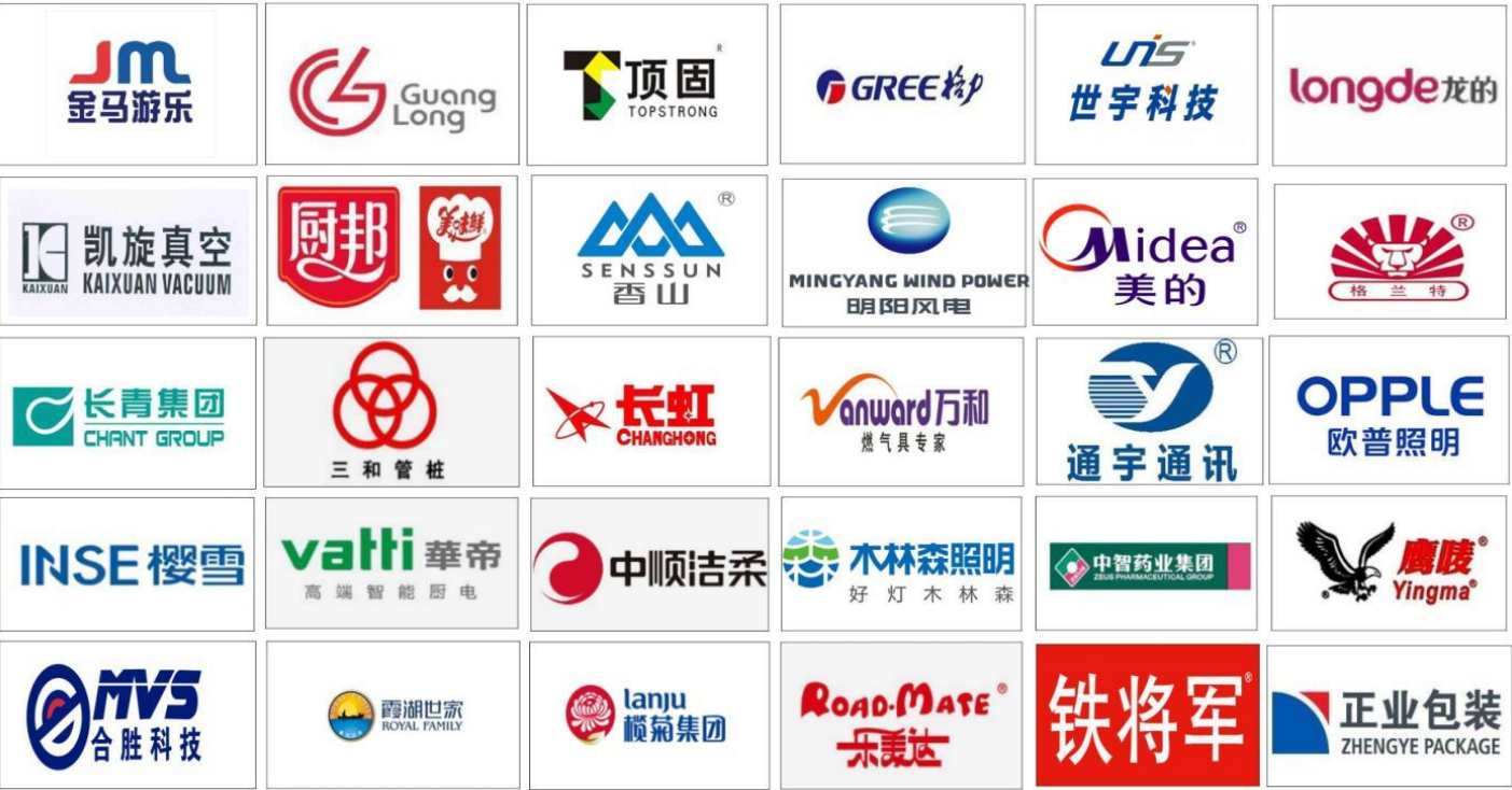
▲ 部分买家集群，排名不分先后

中山工博会将聚焦十大核心应用领域，包含：家电、灯饰、五金、医疗器械、新能源、汽车零部件、电子、光电、家具、服装等，致力于推动产业链上下游高效精准对接，助力企业提质降本，强化供应链。在这里，参展企业能直面中山及粤港澳大湾区最真实的采购需求，接触具有决策能力的专业买家，深入理解区域市场的独特需求特点。